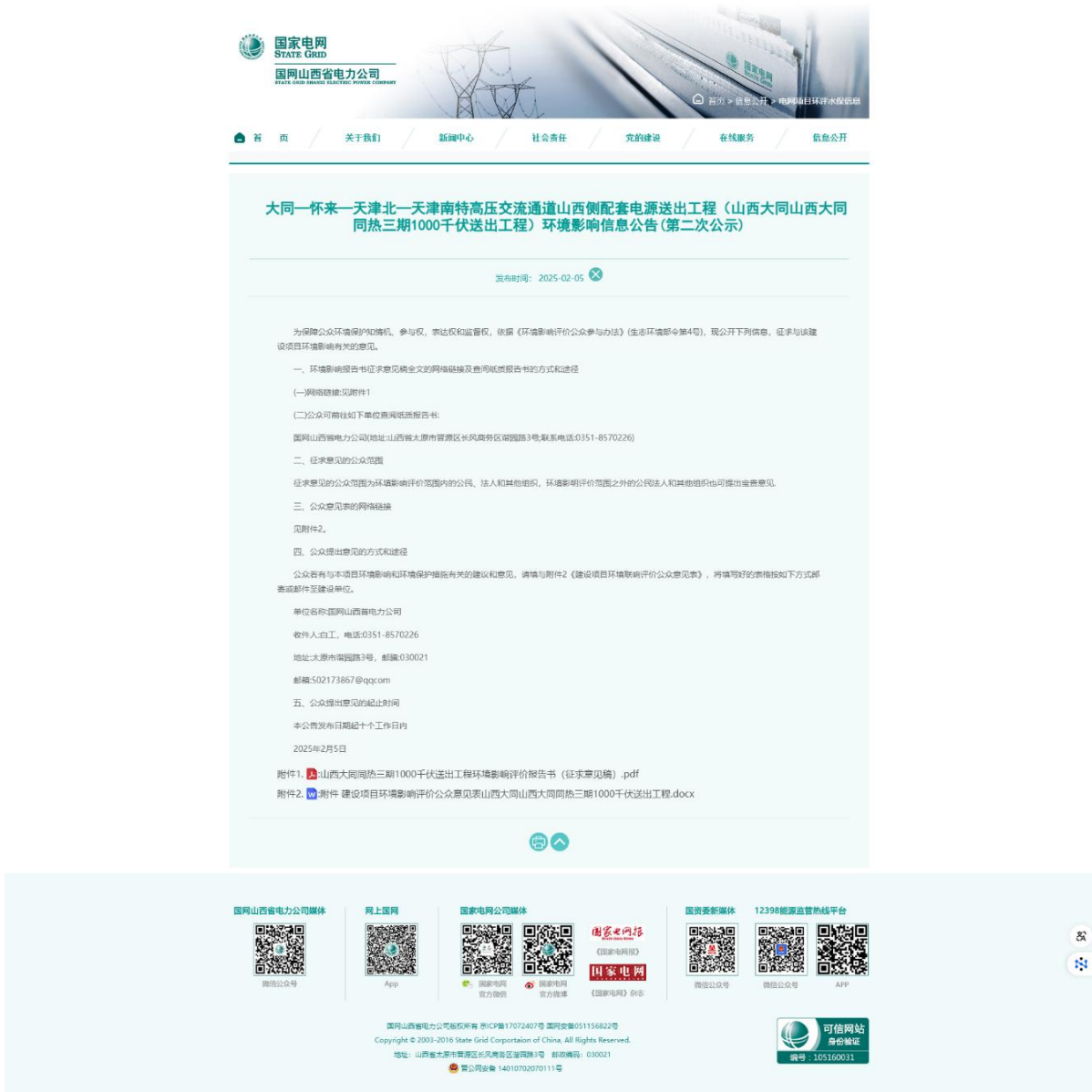
图 3.2-1 环境影响评价公众参与第二次公示（网络平台）