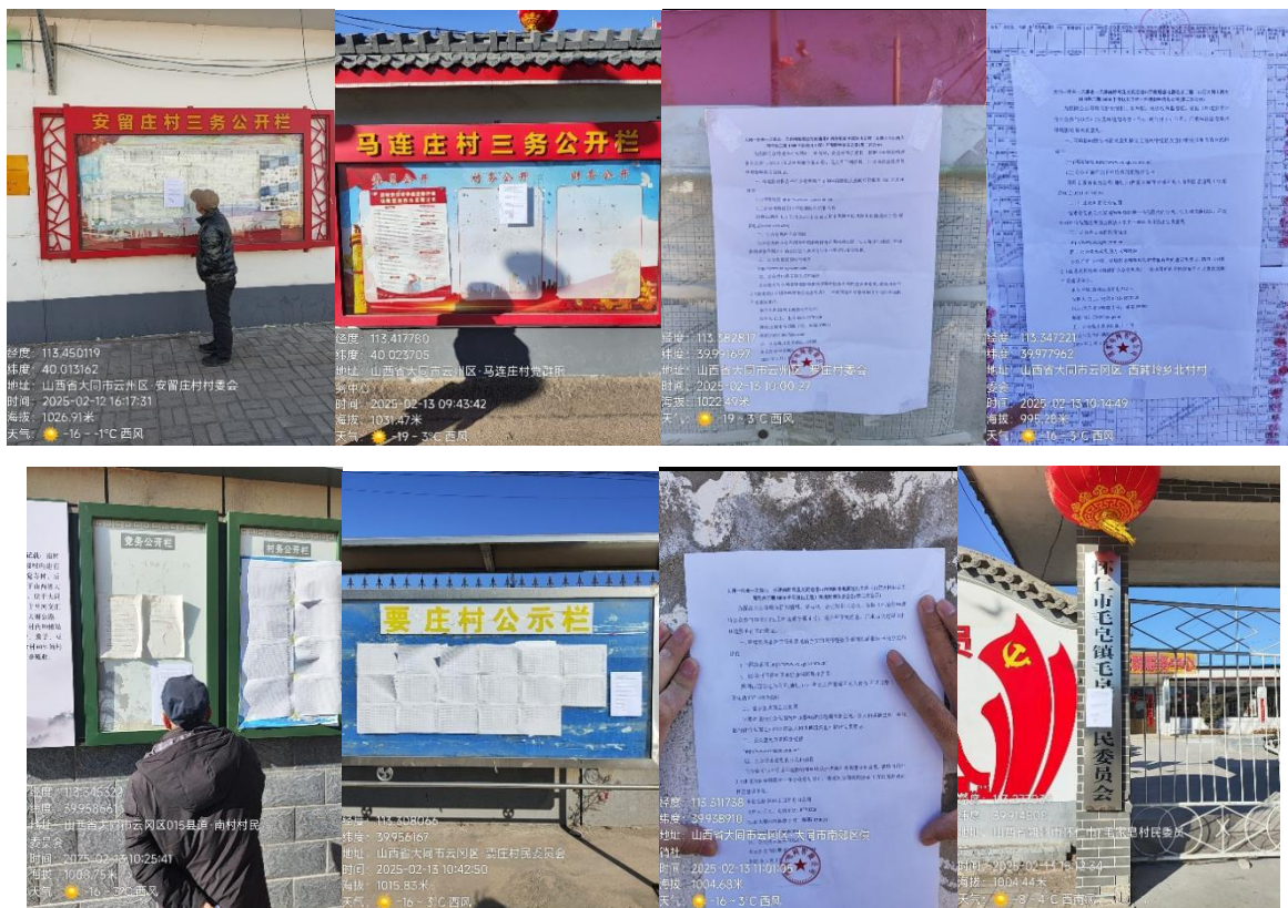
图 3.2-3 环境影响评价公众参与第二次公示（张贴公告）